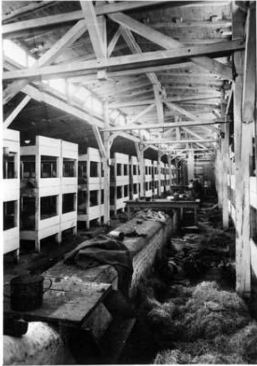
Abb.: Zigeunerlager Auschwitz-Birkenau B II e Das Innere einer Baracke