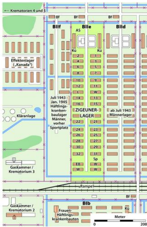
Abb.: Lageplan des Zigeunerlagers Auschwitz-Birkenau B II e