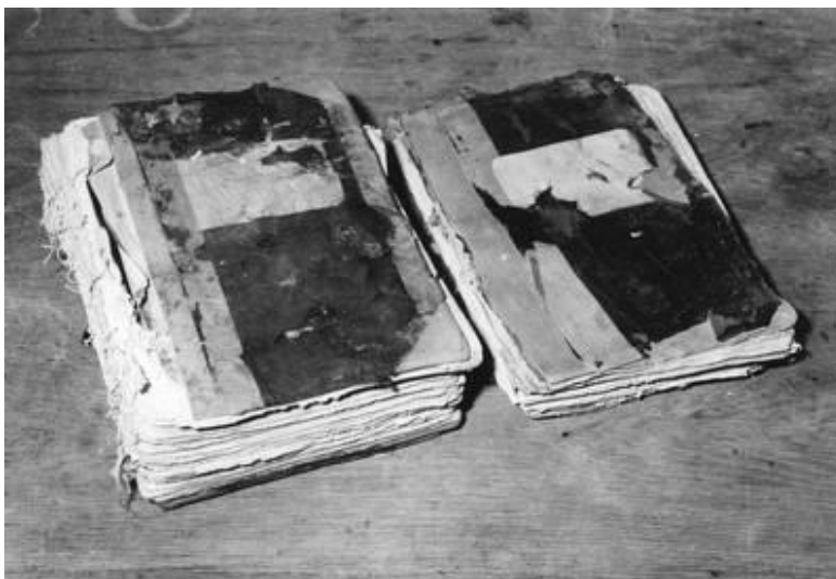
Abb.: Die Hauptbücher (siehe Endnote 8)