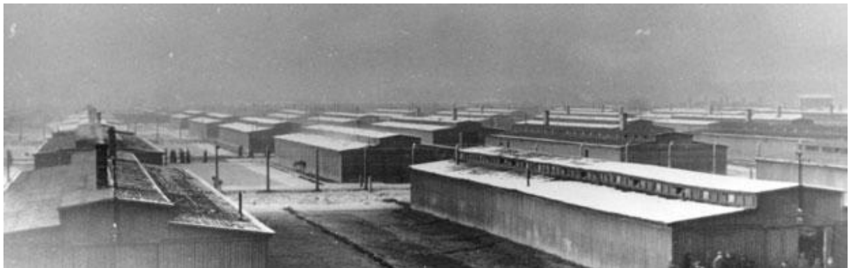
Abb.: Zigeunerlager Auschwitz-Birkenau B II e